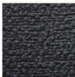
▲ Storm coal