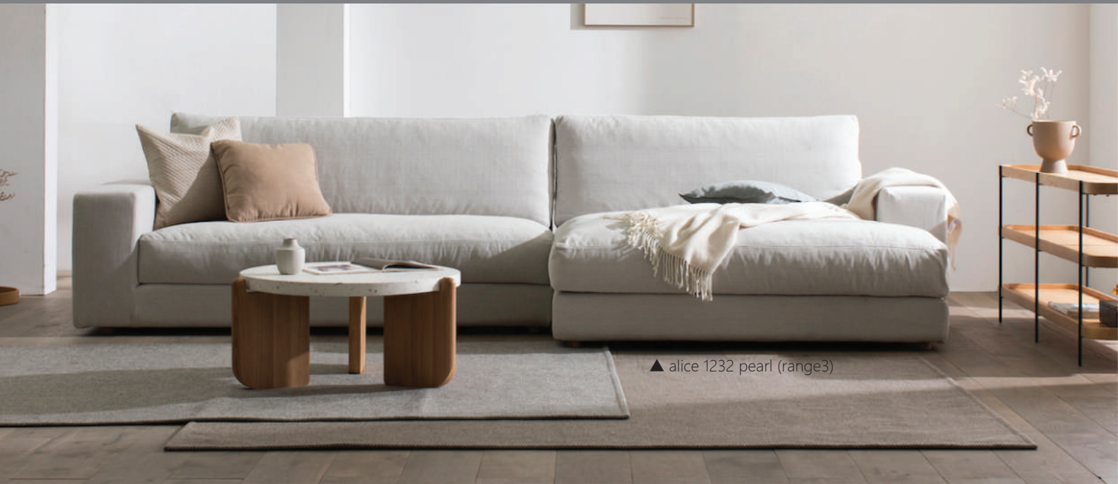
▲ alice 1232 pearl (range3)

ゆったりサイズのコーナーソファ。座面内部のウレタン層は硬い層と柔らかい層の二層にし、しっかりと荷重を支えながら包み込まれるような抜群の座り心地を実現しました。別売りサイドクッションを大きさ違いや色違いで組み合わせるとアクセントになります。