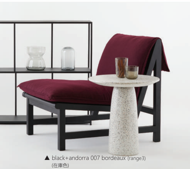
▲ black+andorra 007 bordeaux (range3) (在庫色)