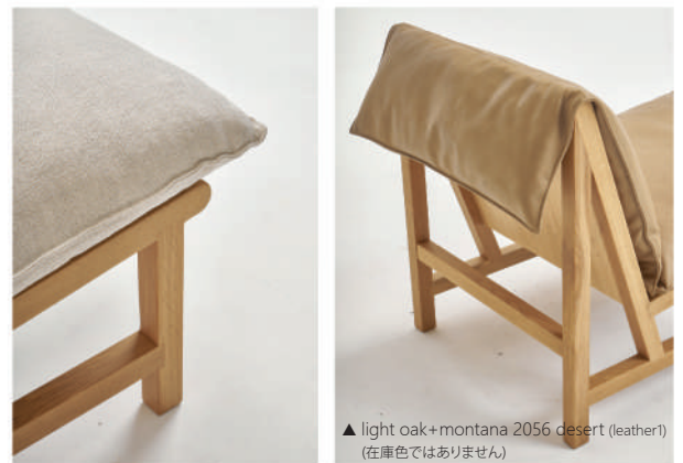
▲ light oak+montana 2056 desert (leather1) (在庫色ではありません)

Cameron Foggoはオーストラリア・シドニーを活動拠点にするインテリアデザイナー。2007年に自身のデザインスタジオを構え、家具から内装に至るまで多彩なデザインワークの実績を積み上げています。伝統的な手法に則りながら洗練された機能美を表現するのが彼の哲学。2018年からSketchブランドのデザイナーに参画し、より幅広いコレクションを生み出し始めています。