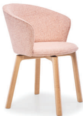
▲ light oak+gutai 7801 cat's paw (range 4) ※在庫色ではありません