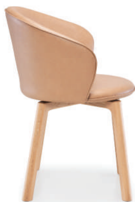
▲ light oak+alabama 003 pecan (leather 1) ※在庫色ではありません