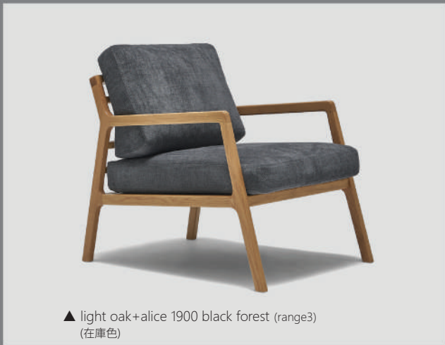
▲ light oak+alice 1900 black forest (range3) (在庫色)

フォーマルな応接セット、ソファの対面チェア、ベッドルーム、エントランスなど多用途で使いやすいラウンジチェア。背クッションには三層のウレタンにフェザー・ファイバー、シートクッションには10cm厚のウレタンにフェザー・ファイバー。座り心地にもこだわった中材を厳選使用しています。