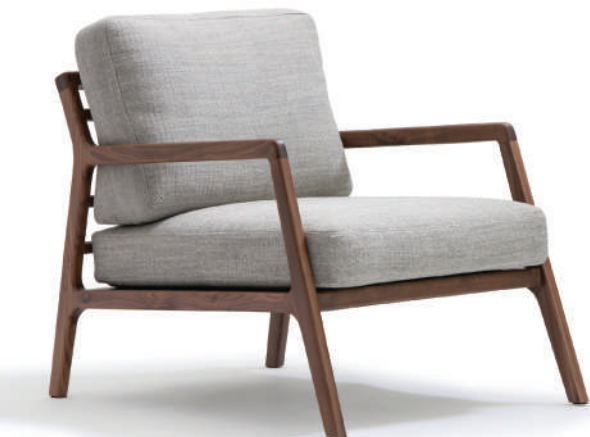
▲ walnut+westlake 07 harbour grey (range2) (在庫色)