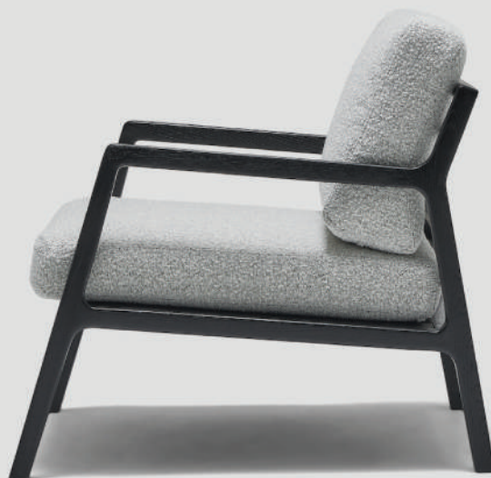
▲ black+bigello 3 salt & pepper (在庫色ではありません)