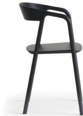
▲ Wood / black ※在庫色ではありません