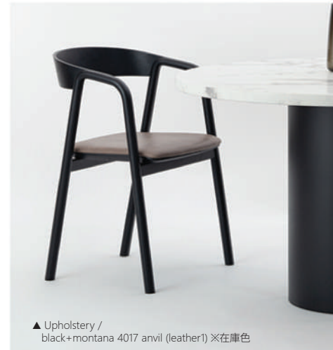
▲ Upholstery / black+montana 4017 anvil (leather1) ※在庫色