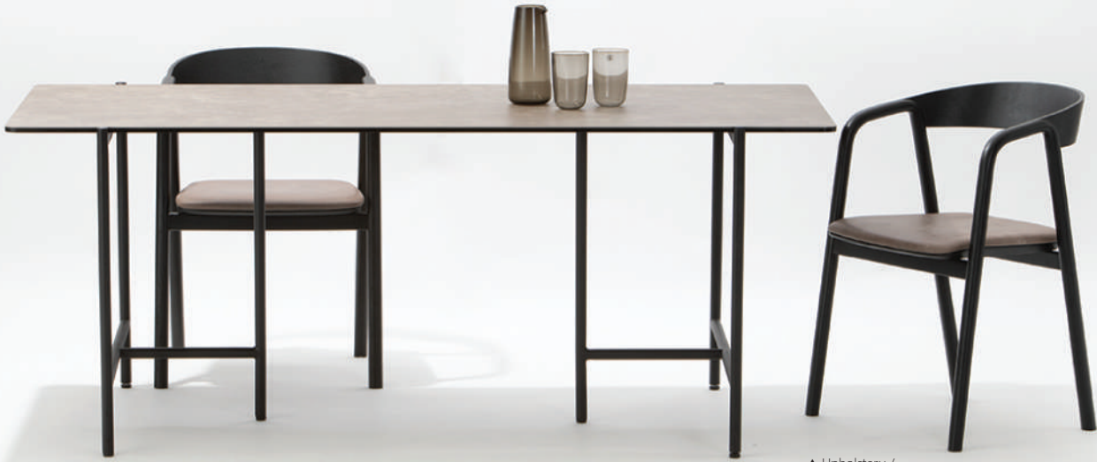
▲ Upholstery / black+montana 4017 anvil (leather1) ※在庫色

アームと背もたれ、それぞれのカーブがシームレスに組み合わせられた美しいラインが特徴。コンパクトながら背と座の絶妙な曲面により抜群の座り心地です。ダイニングの他、ワークチェアとしてもおすすめです。オールウッドタイプと張込みタイプ(ファブリック or レザー)がご選べいただけます。