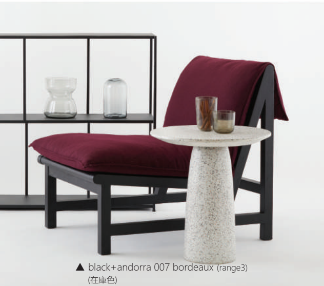
▲ black+andorra 007 bordeaux (range3) (在庫色)

▼ walnut stain+bigello 3 salt & pepper (range3 / 在庫色)