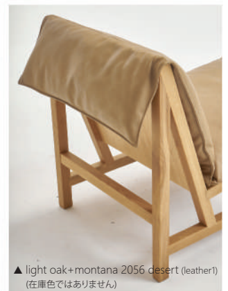
▲ light oak+montana 2056 desert (leather1) (在庫色ではありません)

FRAME オーク無垢材PU塗装 ( light oak / black / walnut stain ) ・高強度テープ(シートベルト) FILLING フェザー・ボールファイバー 高密度ウレタンフォーム (35kg/m 3 コールドキュアフォーム / Spring Foam ) COVER LOOSE