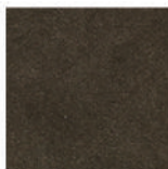
▲ nanofiber mocha