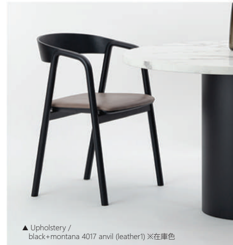
▲ Upholstery / black+montana 4017 anvil (leather1) ※在庫色