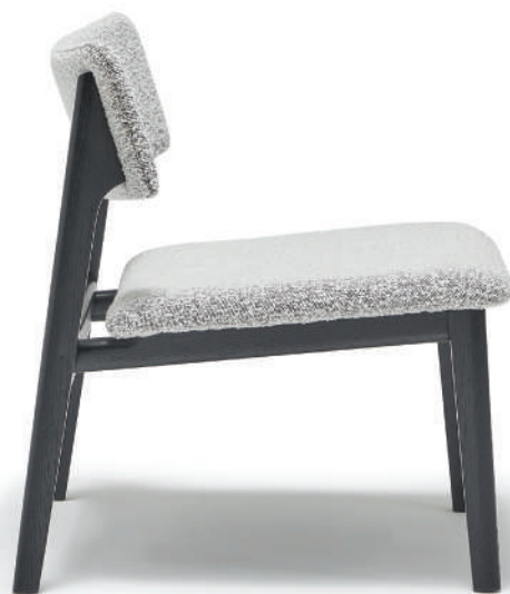
▲ black+bigello 0003 salt &amp; pepper (range3)

FRAME オーク無垢材 PU塗装 (light oak / black) SEAT プライウッド, 高密度ウレタンフォーム LEG オーク無垢材 COVER FIX