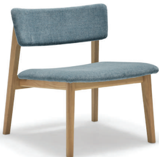
▼ light oak+sylvia 0449 ciel (range3) ※在庫色