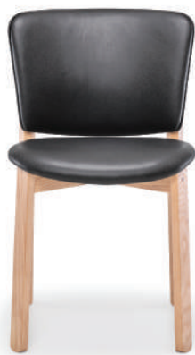
▲ light oak+alabama 005 armour (leather 1) ※在庫色ではありません