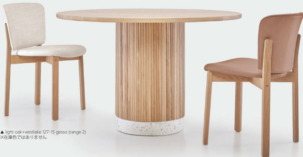
▲ light oak+westlake 127-15 gesso (range 2) ※在庫色ではありません

どこか柔らかな雰囲気も醸し出す、シャープさと柔らかさとの絶妙なバランスを取ったチェア。 幅広の座面と背中にフィットする背もたれラインで長時間でもゆったりと快適に着座姿勢を保つことができます。