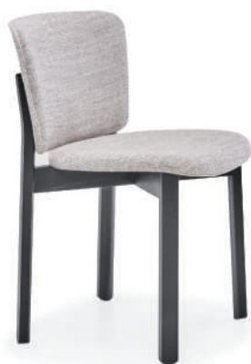
▲ black+westlake 127-07 harbour grey (range 2) ※在庫色ではありません