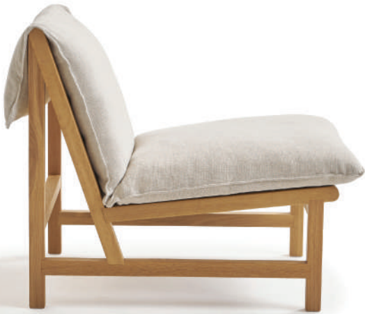
▲ light oak+alice 1232 pearl (range3) (在庫色ではありません)