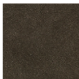
▲ nanofiber mocha