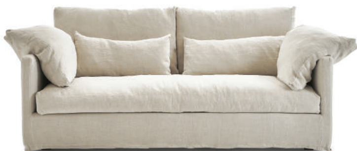
▲ westlake 01 oatmeal (range2) (在庫色)