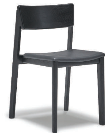
▲ black+montana 1048 coal (leather1) ※在庫色