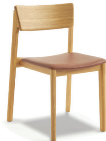
▲ light oak+heritage 002 saddle (leather2) ※在庫色