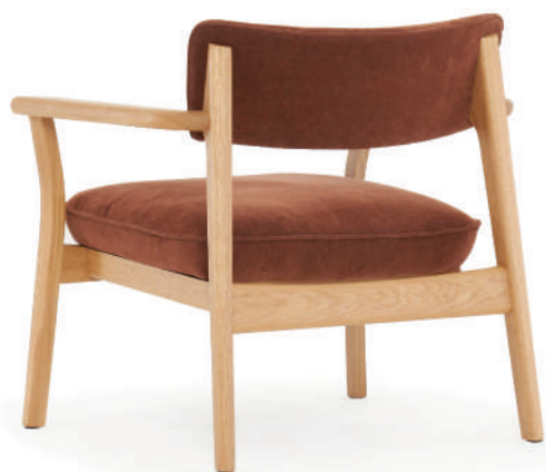
▲ light oak+sahara 0015 russet (range3)

スタンダードなフォルムの中に、さりげないカーブのディテールにより柔らかさとの絶妙なバランスを取ったチェア。幅広い座面と背中にフィットする背もたれラインで長時間でもゆったりと快適に着座姿勢を保つことができます。座面のコア部分にはメモリーフォームを使用し、ふっくらと心地よい座り心地。