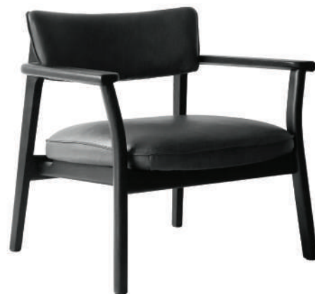
▲ black+alabama 005 armour (leather 1) ※在庫色