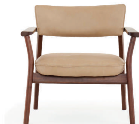
▲ walnut+montana 2056 desert (leather 2)