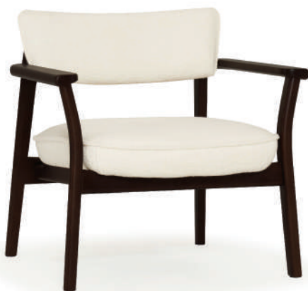
▲ black+cobbler 0001 panna cotta (range 3)