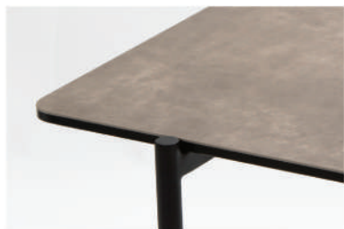
▲ ceramic grey