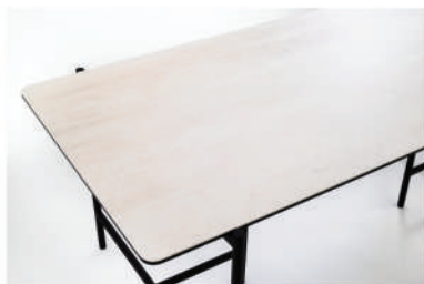
▲ ceramic white