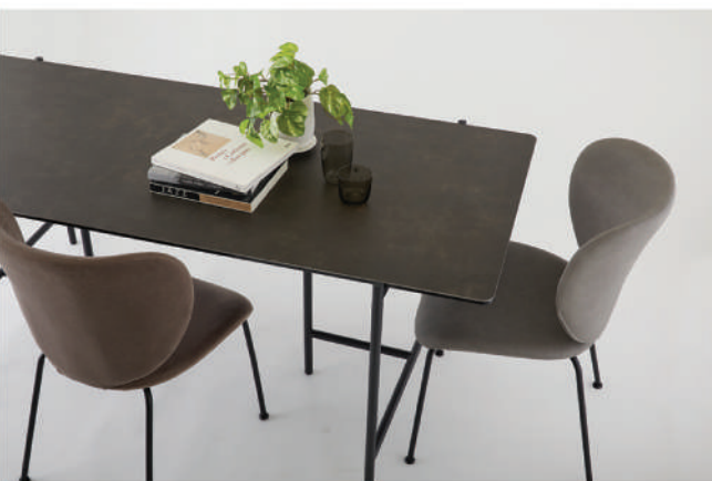
▲ ceramic slate

ceramic grey ceramic white ceramic slate