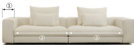
▲ creme (range2) ※在庫色