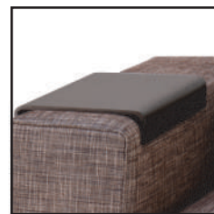
armrest tray アームレストトレイ

幅 29 奥行 45 高さ 7 cm カラー：walnut/light wenge