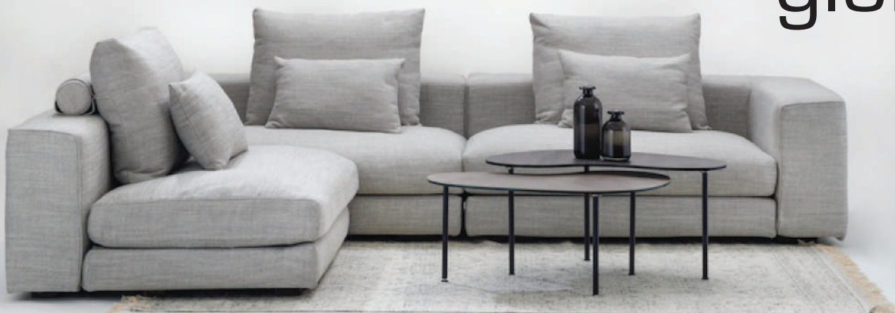
▲ silver (range2) ※在庫色