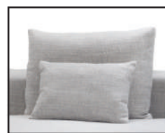
extra cushion small