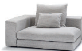
globe M (向かって左アーム)

グラスやカップなどが置ける、寛ぎスペースをより便利にしてくれるアイテムです。アーム幅が 26.5cm のソファにご利用できます。