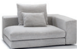
globe X (向かって右アーム)