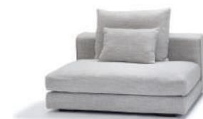
globe I (アームレス)