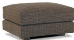
globe ottoman M 幅 70 奥行 55 高さ 37 cm