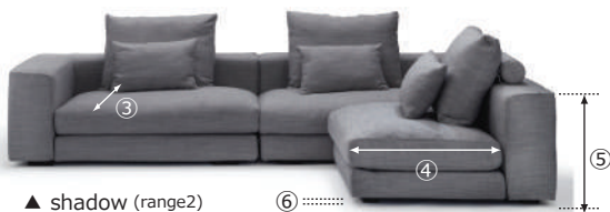
▲ shadow (range2) ⑥ ……: