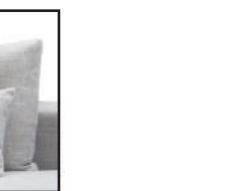
extra cushion large