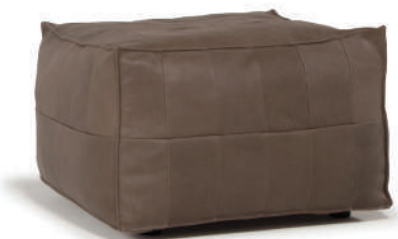
▲ TANBO / montana 4017 anvil (在庫色ではありません)

レザーソファ生産過程では約40%の革がはじかれ廃棄されてしまいます。それらスクラップ革の有効活用のために生まれたエコ製品。内部のクッション材には同じくソファ生産過程で発生するウレタンフォームのハギレを粉砕し詰め物として有効活用しています。素材の品質としては問題ないのに廃棄される原材料をできる限り少量化し、新たな製品へと繋げていく、Sketch工場の生産現場から生まれた新しいツールです。