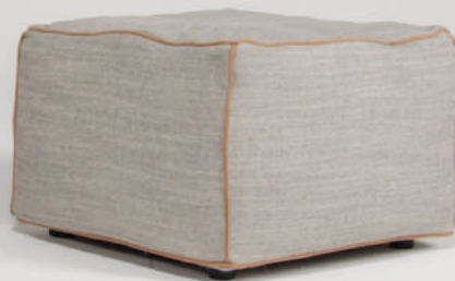
▲ westlake 07 harbour grey (range2) piping: montana 3031 canyon (leather) (在庫色)