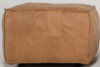
▲ montana 3031 canyon (leather 1) (在庫色)