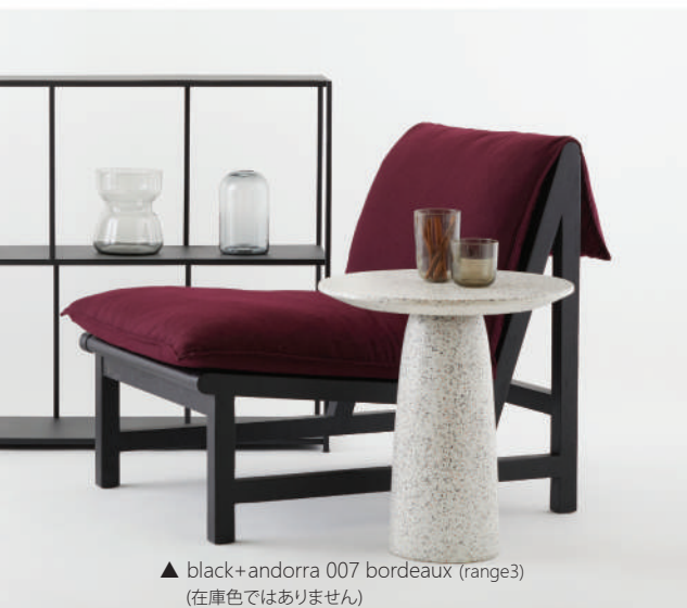
▲ black+andorra 007 bordeaux (range3) (在庫色ではありません)