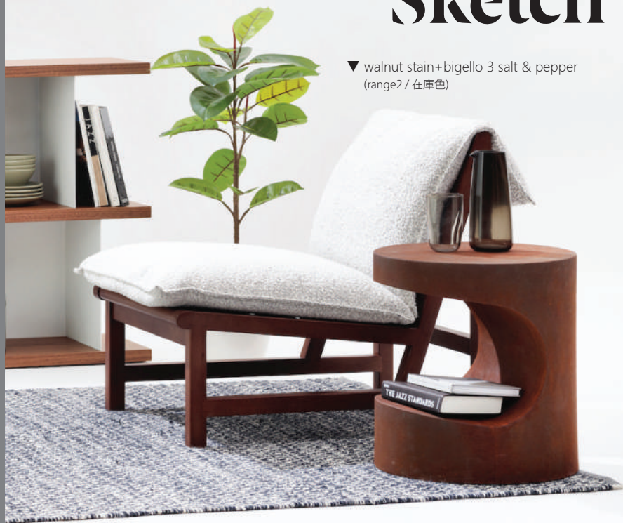
▼ walnut stain+bigello 3 salt & pepper (range2 / 在庫色)

直線を組み合わせた幾何学的な無垢材構造がそのままデザインとなっているラウンジチェア。部材のジョイント部分も美しく、建築の躯体の美しさを表現したような一台です。コンパクトなサイズでリビングのソファ対面の他、パーソナルスペースでも使いやすいサイズ。オーク無垢材をふんだんに使い、安定感も抜群です。