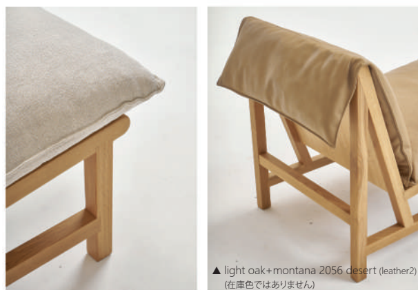
▲ light oak+montana 2056 desert (leather2) (在庫色ではありません)

Cameron Foggoはオーストラリア・シドニーを活動拠点にするインテリアデザイナー。2007年に自身のデザインスタジオを構え、家具から内装に至るまで多彩なデザインワークの実績を積み上げています。伝統的な手法に則りながら洗練された機能美を表現するのが彼の哲学。2018年からSketchブランドのデザイナーに参画し、より幅広いコレクションを生み出し始めています。